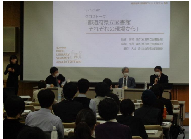
サミットのクロストーク