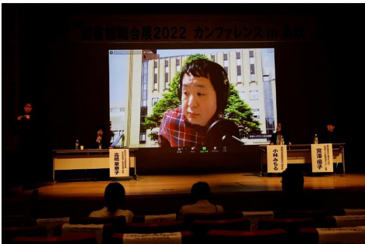
総合展のパネルディスカッション